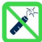
Articles pyrotechniques et matériels explosifs Pyrotechnics and explosive materials