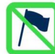
Hampes rigides, Fagots de drapeaux Flagpoles