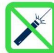
Pointeurs laser Laser Pointers