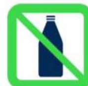
Bouteilles - Verres - Canettes Bottles - Glasses - Cans