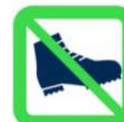
Chaussures de sécurité Safety Footwears