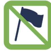
Hampes rigides, fagots de drapeaux