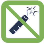
Articles pyrotechniques et matériels explosifs