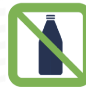
Bouteilles, Contenants à bouchon, Verres, Canettes