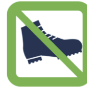
Chaussures de sécurité