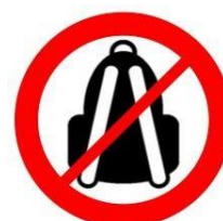
Sacs à dos Backpacks