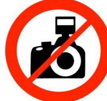
Appareils photos reflex Reflex still cameras