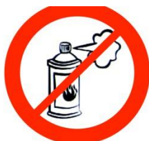
Spray au gaz Gas spray can