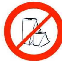
Rouleaux de papier Rolls of paper