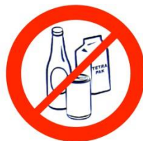
Bouteilles, canettes Bottles, cans