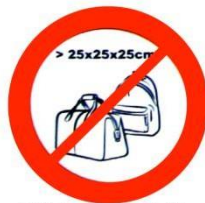
Objets peu maniables Unwieldy objects