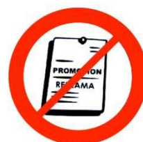
Matériel promotionnel Promotional material