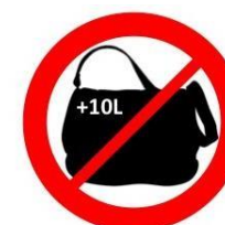
Contenant de plus de 10L More than 2 gal GB containers