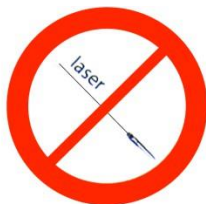
Pointeurs laser Laser pointers