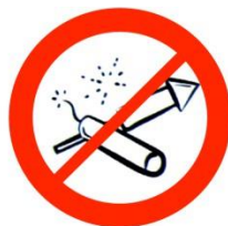
Matériel pyrotechnique Pyrotechnics