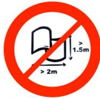
Bannières et drapeaux Banners and flags