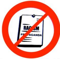
Propagande discriminatoire Discriminatory propaganda