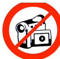
Equipement d'enregistrement Recording equipment