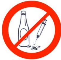
Alcool, drogues Alcohol, drugs