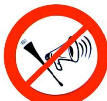
Instruments produisant du bruit Sound-emitting devices