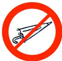
Grands parapluies Long umbrellas